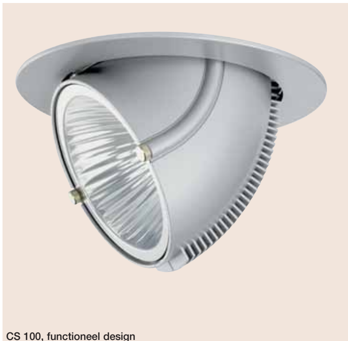
CS 100, functioneel design