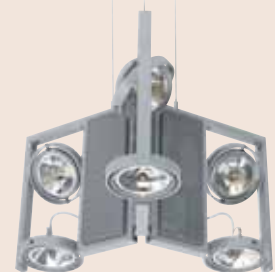
SP 10/3535 H = 457